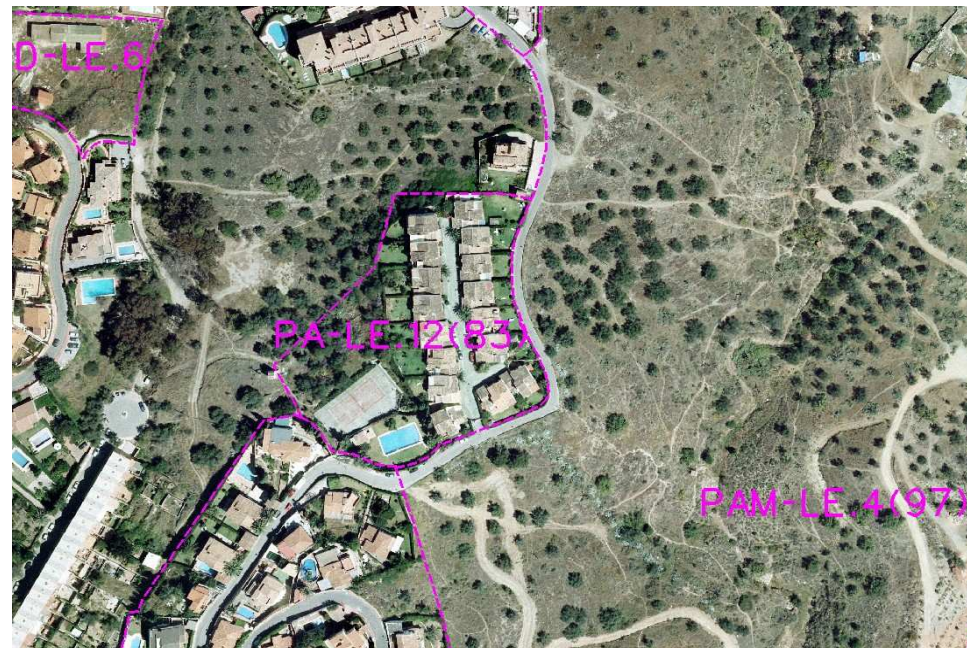
Ordenación Pormenorizada Completa

Plan Especial de Infraestructuras Básicas: